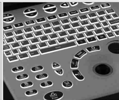
Teclado con luz posterior